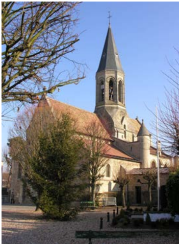
Die Kirche von Louveciennes

Siehe hierzu auch die gesonderte Programminformation des Städtepartnerschafts - Komitees.