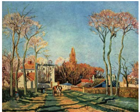
Entrée de Village de Voisins, Pissarro 1872

Louveciennes, ein kleiner Vorort von Paris, unweit vom Schloss Versailles, war Wohnort für viele berühmte Künstler wie Camille Pissarro, Kurt Weill, (Dreigroschenoper) der hier von 1933-1935 Zuflucht vor dem Nazi-Regime gefunden hat, Auguste Renoir, und auch der Komponist und Organist Camille Saint-Saëns wohnte von 1865-1870 in dem Dorf Voisins, was heute zu Louveciennes gehört.